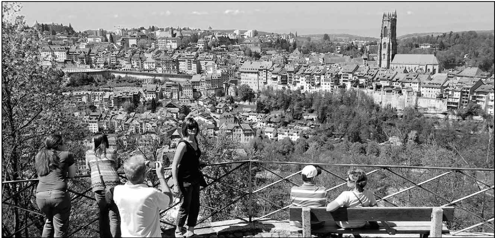
Selon le revenu librement disponible (déduction faite des prélèvements obligatoires et du coût du logement), Fribourg occupe la première place en Suisse romande.

CANTON DE FRIBOURG • Une étude de Credit Suisse le confirme: les Fribourgeois ont de bons atouts en main. Démographie en verve, économie modernisée, terrains disponibles.